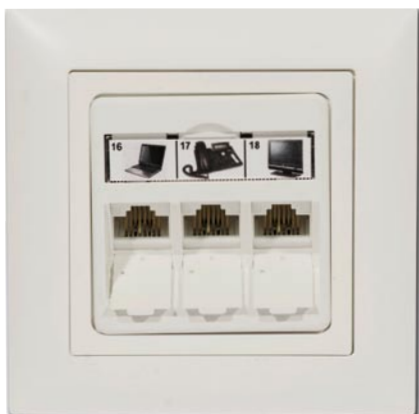
Bild 1 Glasfaseranschlussdose.

Eine besondere Herausforderung stellt die Verkabelung innerhalb von bestehenden Gebäuden dar. Bei Neubauten kann man bereits bei der Bauplanung die spezifischen Anforderungen von FTTH berücksichtigen und beispielsweise die Einschränkungen von Glasfaser bezüglich der Krümmung der Kabel und der mechanischen Empfindlichkeit berücksichtigen. Allerdings gibt es zunehmend mehr